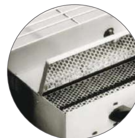
Boîtier de contrôle + ventilation / Control box + ventilation