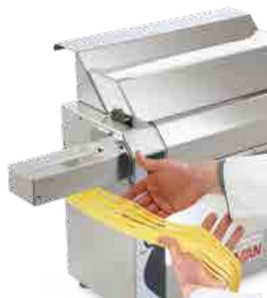
可选件：压面机切刀