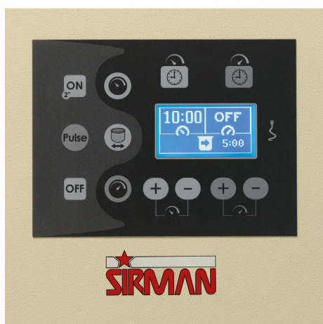
Hercules Biga 控制面板

BIGA 是意大利烘焙中的一种预发酵方式，其做出的面包比用普通的发酵剂口感更丰富、更浓厚。将面粉、水和酵母以一定比例混合，经过所需的发酵时间后，再与其它原材料相混合，以获得既脆又香的面包，最典型的例子就是“ciabatta”面包。