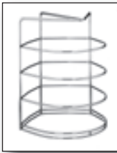
无盖 “P” 型盘托