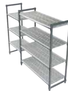
基础架 + 扩展架