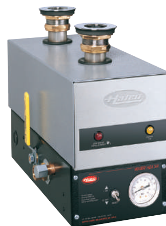
3CS-9帶有可選的溫度表