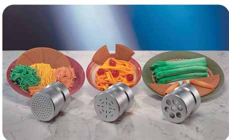
模具（窄面条,宽面条,芦笋）