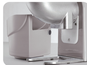
收集槽带安全微限开关