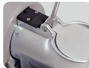
压杆处带安全微限开关