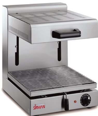
SALAMANDRA PRO 1/2 G