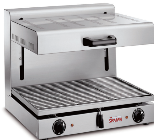
SALAMANDRA PRO 1/1 G